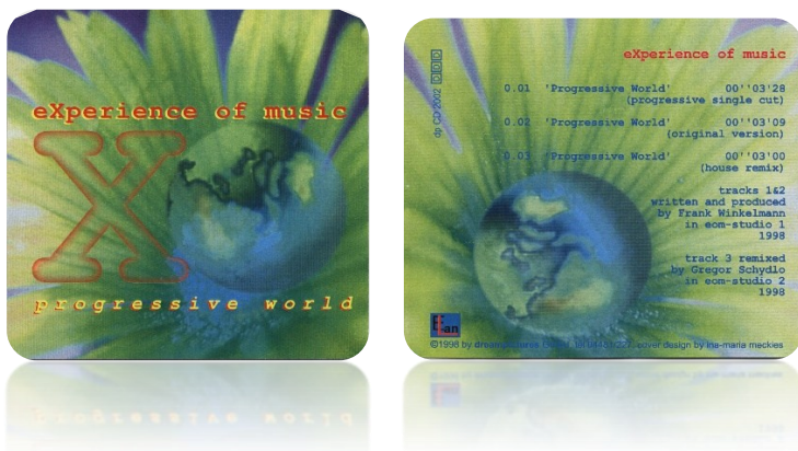
Abbildung: CD-R „Progressive World“