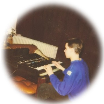
Foto: I. Winkelmann: ca. 1994, ich an den Keyboards im elterlichen Wohnzimmer

Doch eine Formation stand über allem: CAPPELLA . Das kreative Imperium um Gianfranco Bortolotti war für mich kein bloßes Pop-Phänomen, sondern ein perfekt orchestriertes Kunstwerk seines Labels Media Records. Mein Ziel war klar: Ich wollte genau diese Musik machen. Ich wollte dazugehören, beachtet werden und im Strom dieser synthetischen Energie mitschwimmen.