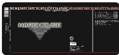
Abbildung: CD „Hardhouse“