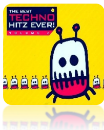
Abbildung: 2-CD „The Best Techno Hitz Ever Vol. 2 (2006)“