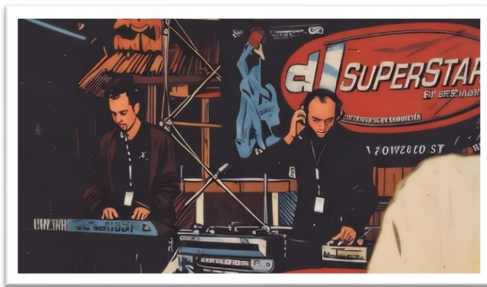
Foto: A. Eymann 2004, Diskothek „Musikpark A 4“ in Köln (digital bearbeitet)

Wir konnten uns aber leider nicht für die Finalrunde qualifizieren. Egal, es hat riesigen Spaß gemacht.