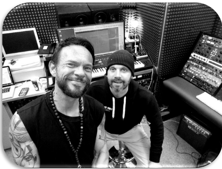
Foto: Selfie T. Detert 2024, Thomas & ich (Airbase Media Tonstudio, Holzwickede)

Ein besonderer Dank und Grüße gehen raus an meinen Music Buddy Thomas alias 666.