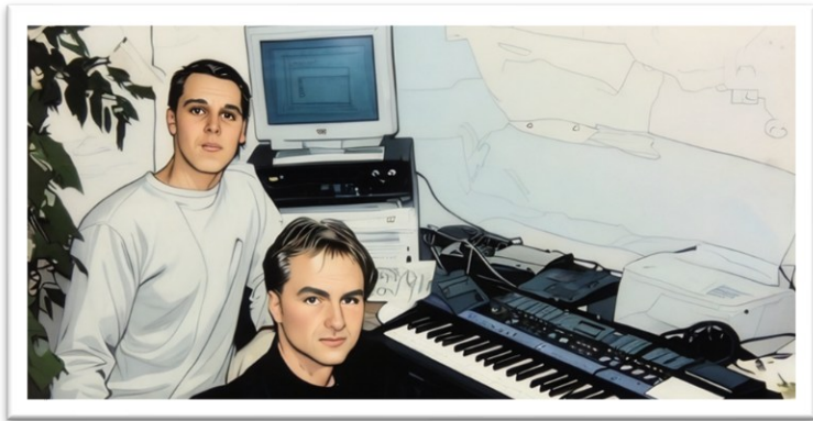
Foto: R. Schydlo 1998, Gregors Kinderzimmer in Köln-Mülheim (digital bearbeitet)

Braunsfeld mit unseren Rädern gefahren. Passiert ist jedoch erst einmal nichts.