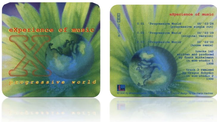
Abbildung: CD-R „Progressive World“